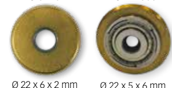
Ø 22 x 6 x 2 mm